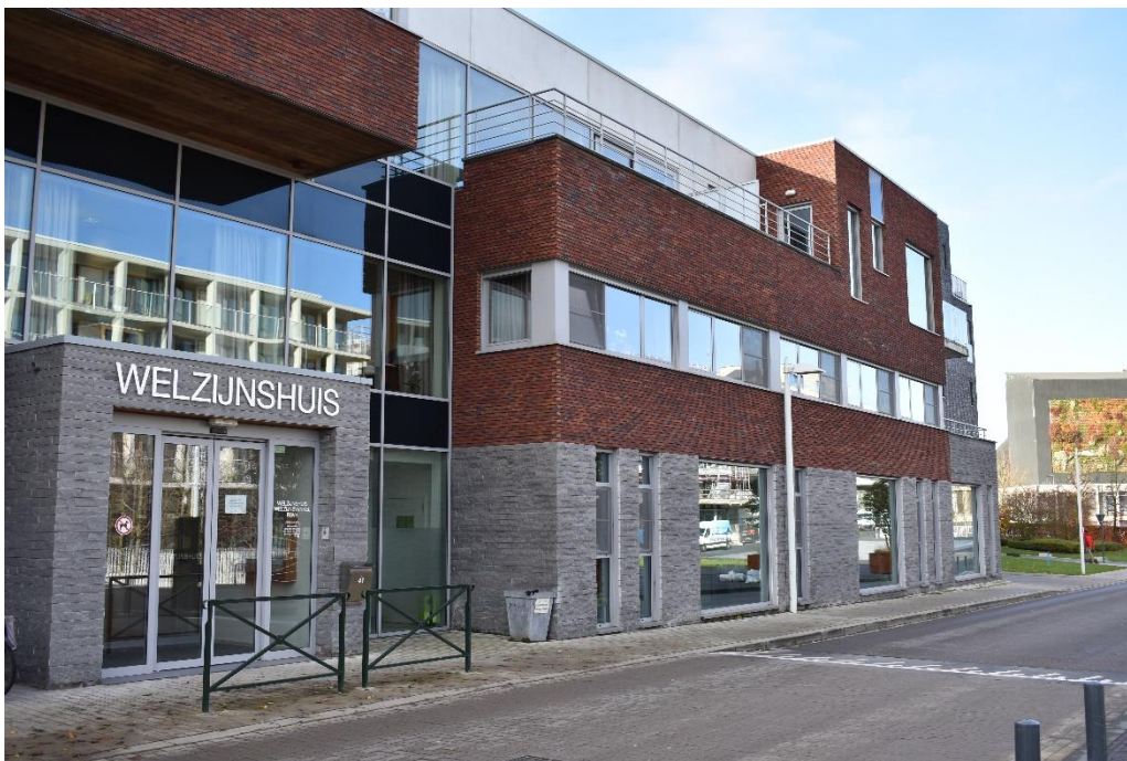
Welzijnshuis Stad Waregem

Heb jij interesse? Neem dan verder een kijkje in onze informatiebundel.